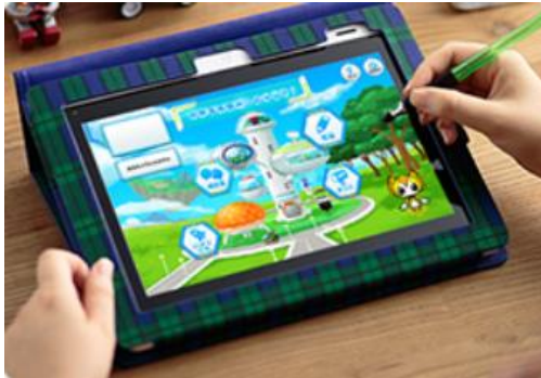
「チャレンジパッド 2」本体画面