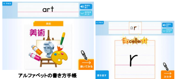
アルファベットの書き方手帳 専用ペンで直接画面に書いて 練習することができます。

進研ゼミ専用タブレットを使った〈ハイブリッドスタイル〉では、専用のタッチペンを使い「見て」「聞いて」「書いて」の学習はタブレットを中心にしながら、赤ペン先生の問題やテスト教材など、記述の必要性が高いもの、一覧性が求められるものについては、従来の紙で提供することで、学習のインプットとアウトプットをバランスよく行きます。