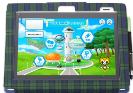
新開発の進研ゼミ専用タブレット 「チャレンジパッド2」

ベネッセは今後も、お客さまのニーズにあった学習スタイルを提供することで、子どもたちが自宅でひとりでも、安心・安全に学習を続けることができる講座を提供してまいります。