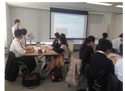
職業体験セミナーに参加する学生

システムエンジニアの職業体験セミナーや求人紹介セミナーなど、限られた時間での仕事研究、企業研究をサポートするための様々なイベントを開催。広報解禁から選考開始までの3月から6月にかけて、約50回のセミナーを開催予定です。IT・Web企業紹介セミナーやBtoB企業紹介セミナーなど、学生がこれまで知らなかった企業に出会えるセミナーの開催も予定しています。