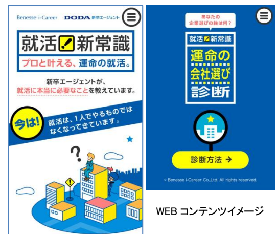
WEBコンテンツイメージ

https://doda-student.jp/joshiki/index.html （2月29日開設）