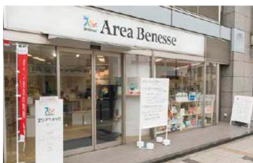
<エリアベネッセ外観>

無料で学びの相談ができる「エリアベネッセ」、進研ゼミプラスを教材として教室で学べる「クラスベネッセ」、提携塾において、ご自宅以外での決まった場所で個別の学習サポートをきめ細やかに行います。その際、「ハイブリッドスタイル」を活用いただいている会員の方には、デジタル教材で蓄積されたお子さまの学習履歴を把握したうえで、アドバイス・サポートを行います。