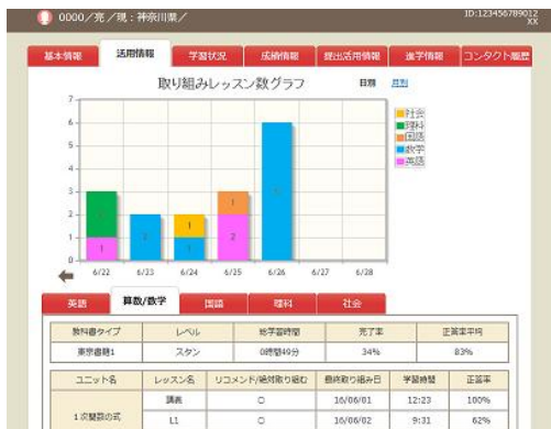
<学習履歴を赤ペンコーチが見守る> ※ハイブリッドスタイル

「赤ペンコーチ」が一人ひとりの学習状況を見守り、個別に学習のサポートを行います。「オリジナルスタイル」では、「赤ペンコーチ」が添削問題の提出状況やマークテストの結果などをもとに、電話やお手紙により、学習サポートを行います。「ハイブリッドスタイル」では、「赤ペンコーチ」がデジタル上の毎日の学習履歴から一人ひとりの得意や苦手を把握し、定期試験前には具体的な学習計画をアドバイス。また、定期試験後には成績を見て、今後の対策をサポートします。