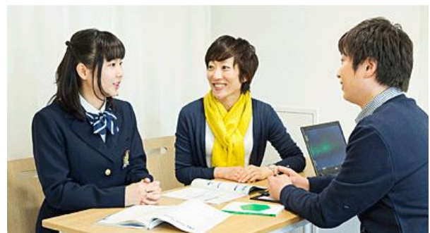
<エリアベネッセにおける学習相談イメージ>