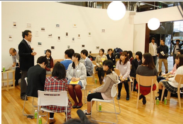
【まなび Meeting 一例】高校生とベネッセ教育総合研究所研究員によるセッションの様子

「まなび Meeting」は、2015 年春までに全国 47 都道府県で約 3,000 回実施、約 20 万人のお客様に御来場いただくことを目標にしています。