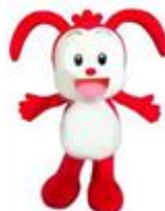
【進研ゼミ小学講座チャレンジタッチ (左)、講座キャラクター「コラショ」(右)】