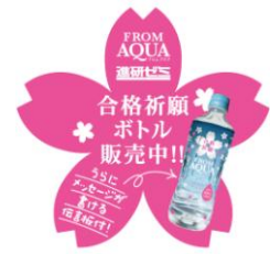
自販機前面ステッカー