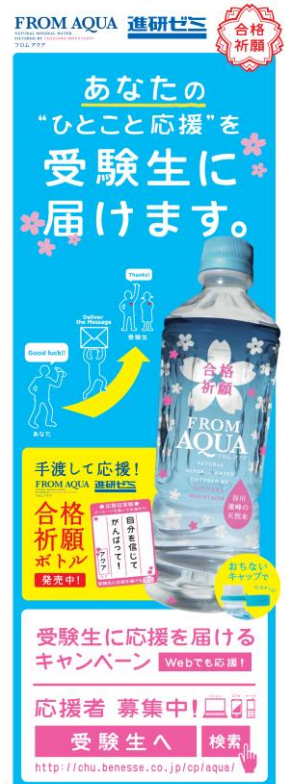
自販機側面ステッカー