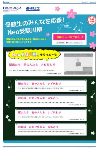
「Neo受験川柳」閲覧ページ