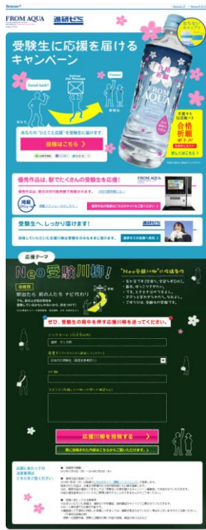
受験生に応援を届けるキャンペーン特設サイト