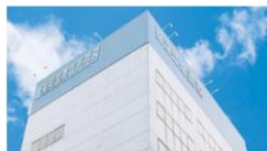
東京国際ビジネスカレッジ (福岡校)