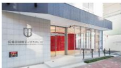
東京国際ビジネスカレッジ (東京)