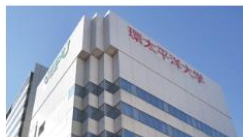
IPU・環太平洋大学 グローバルキャンパス (岡山駅前)