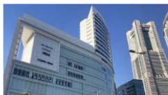
IPU・環太平洋大学 国際科学・教育研究所 (神奈川)