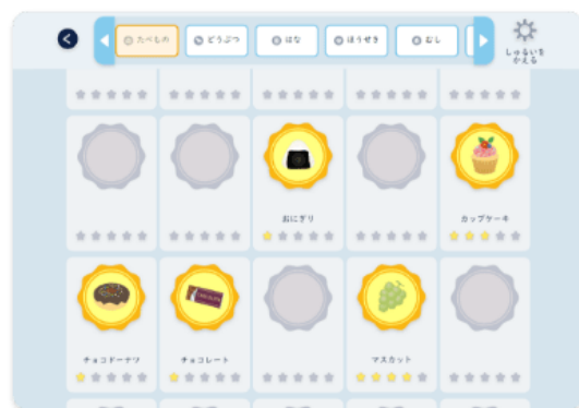
▲取り組みに応じてバッジなどが提供されます