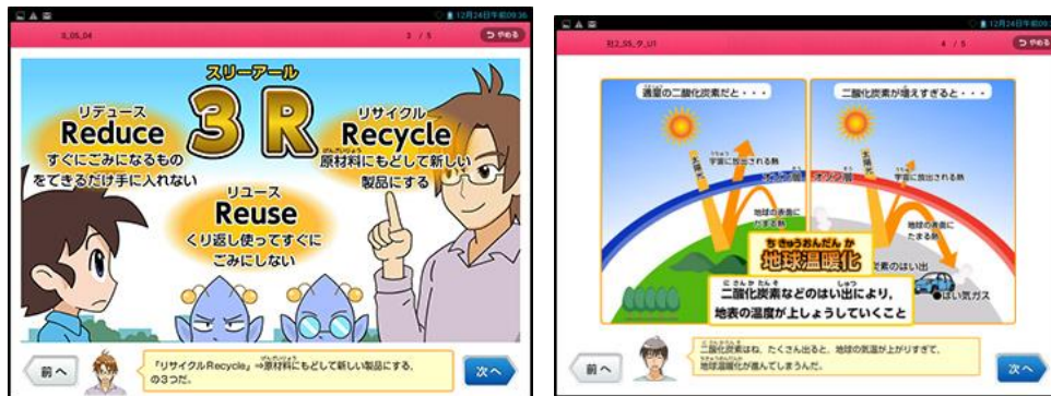
↑：小学4年生や5年生向けに環境を取り上げた教材の事例

また、「進研ゼミ」では、それぞれの学年に応じた内容で環境問題を教材内で取り上げたり、自由研究や小論文のコンクールを開催するなどの取り組みを通して、環境への取り組みの大切さを紹介し、行動を促す取り組みをしています。