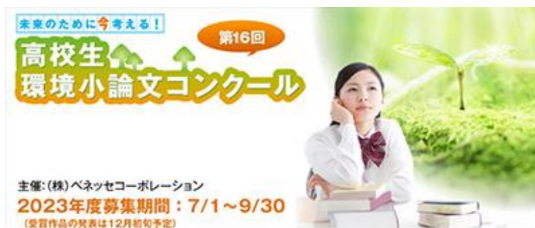
↑：昨年度開催した高校生向け環境小論文コンクールの募集バナー

▶教材を通じた環境教育事例の詳細： https://benesse-hd.disclosure.site/ja/themes/150