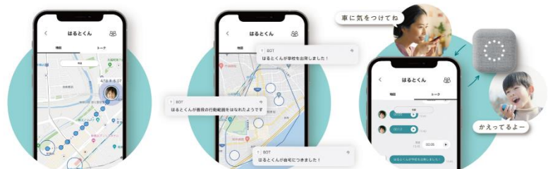
高精度GPSで、子供の足取りまで正確にわかるから安心です。 子供の行動をAIが認識・学習し自動で通知。ずっと見守ります。 親子のトークが無制限に送り合えるから何かあっても連絡がついて安心です。

* 株式会社アイディエーション調べ「子供見守りGPSサービス（GPS端末をアプリで見守るサービス）」でGoogle検索上位10サービス（2023年2月1日時点）を対象にしたインターネット調査（2023年2月10日～2月16日）