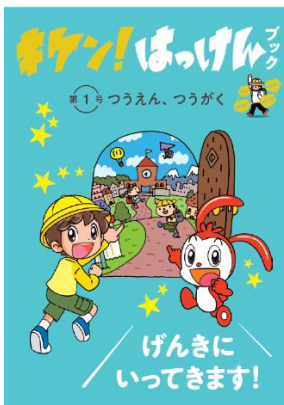
冊子「キケン！はっけんブック」(全 12 号)