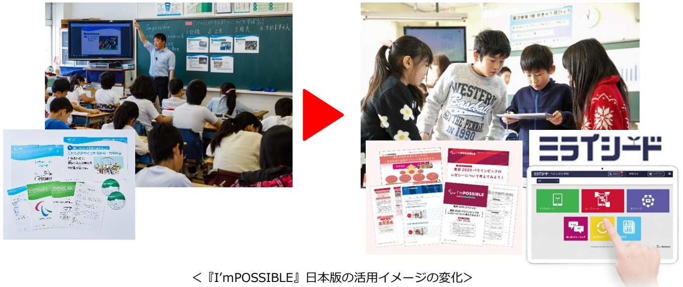
＜『I'mPOSSIBLE』日本版の活用イメージの変化＞

紙の教材からタブレット端末で授業展開が可能なデジタル化したテンプレート+指導案+素材へと進化