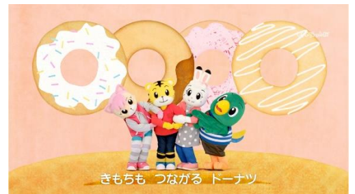
ドドドド ドーナツ（歌・ダンス）