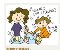
洗濯物で仲間探し