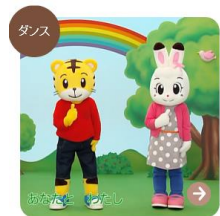
おおきなりのきのしたで