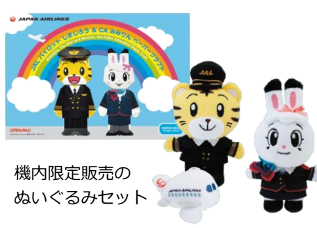
機内限定販売の ぬいぐるみセット