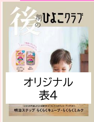
表4 + 表3見開き 合計3ページで展開します