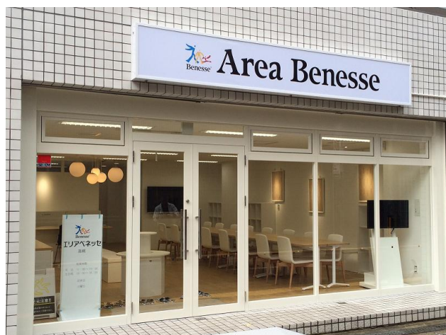
【エリアベネッセ高槻 外観】

教育、暮らしのことなどベネッセグループのすべての知見を集結し、一人ひとりのニーズにあった学びのコンシェルジュサービスを提供することで、エリアベネッセは引き続き、2015年度（年間）延べ約300万人のお客様の来場を目指してまいります。