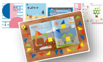
画像：年長向け教材「考える遊びセット」