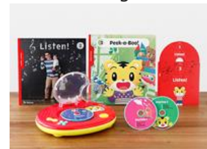
画像：教材「3月開講号」