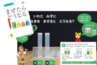
画像：年長向け教材「ガイド冊子」